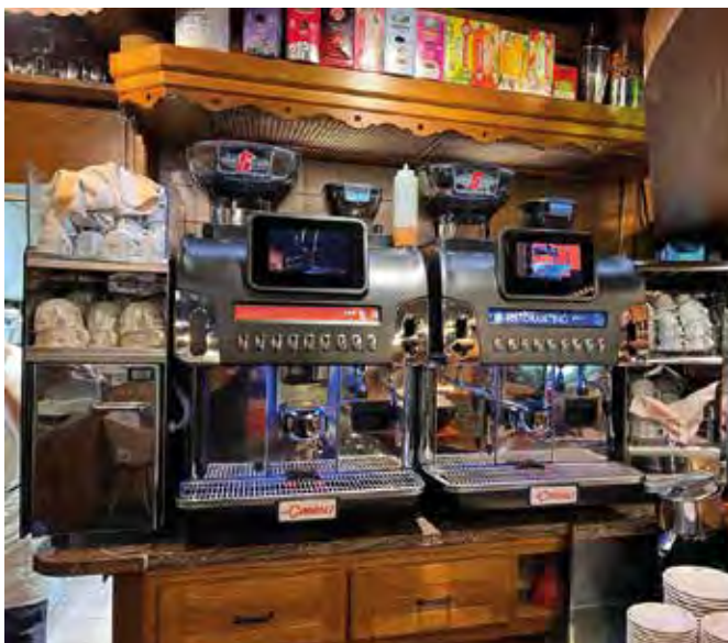
il Ristorantino Courmayeur La Cimbali S60 + Accessori linea S

+39 380 64 93 581 +39 335 74 77 316 info@vibaritalia.com