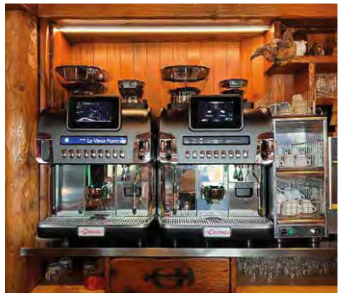
Le Vieux Pommier Courmayeur La Cimbali S60 + Accessori linea S